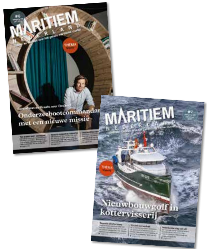
Maritiem Nederland in cijfers

Maritiem Nederland biedt verschillende mogelijkheden om online en offline te adverteren. Denk hierbij aan een advertentie, branded content, online bannering of online advertorials. Deze mediakaart biedt u een overzicht van de standaard mogelijkheden. Maatwerk is uiteraard ook mogelijk. Onze media-adviseur helpt u graag met het bepalen van een passende (multimediale) campagne om uw marketingdoelstellingen te behalen.